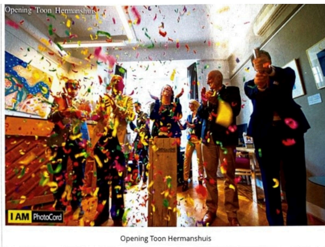
Opening Toon Hermanshuis